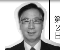
↑ 池亀公和氏 日本獣医生命科学大学 客員教授 食品衛生コンサルタント